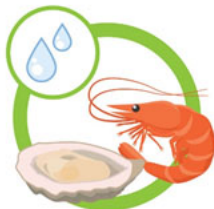
РЫБА И МОРЕПРОДУКТЫ