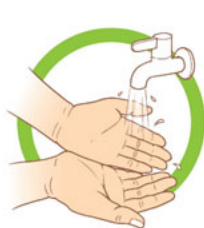
ВОЗЬМИТЕ ЗА ПРАВИЛО!