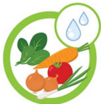
ФРУКТЫ И ОВОЩИ

Роспотребнадзор напоминает – мойте продукты перед приготовлением и употреблением в пищу. Соблюдение простых правил поможет избежать неприятных последствий и снизит риск различных заболеваний.